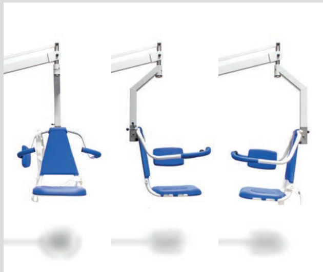
360° Rotation des Badesitzes