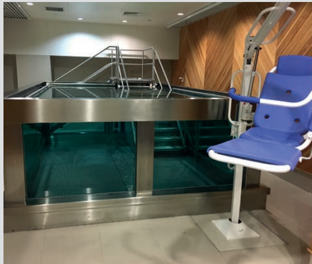
Geeignet für freistehende Pools