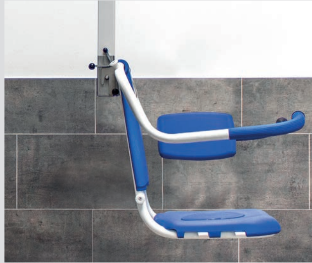
Transfersitz mit Schnellkupplungssystem