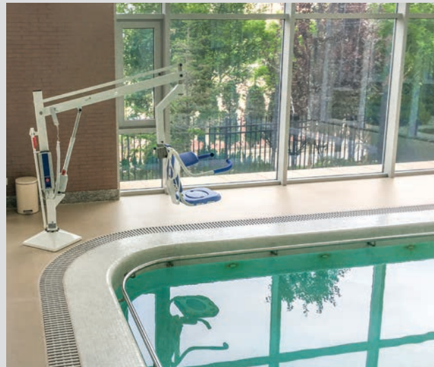
Geeignet für eingelassene Pools