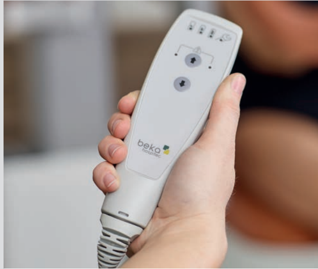
Kabelfernbedienung zur elektrischen Höhenverstellung